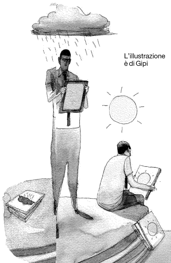
L'illustrazione è di Gipi

“Atmosferologia” di Tonino Griffero (Laterza pagg. 181 euro 19)